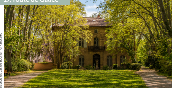
Bastide du Jas de Bouffan

Das als historisches Denkmal eingestufte Landgut Jas de Bouffan mit seinem Park kann mit einer Führung erkundet werden, während der man den Familiensitz des Malers kennenlernt: seinen Lebensraum, mit dem er verwurzelt war und der als Hintergrund für seine ersten Kunstwerke und als Atelier diente.